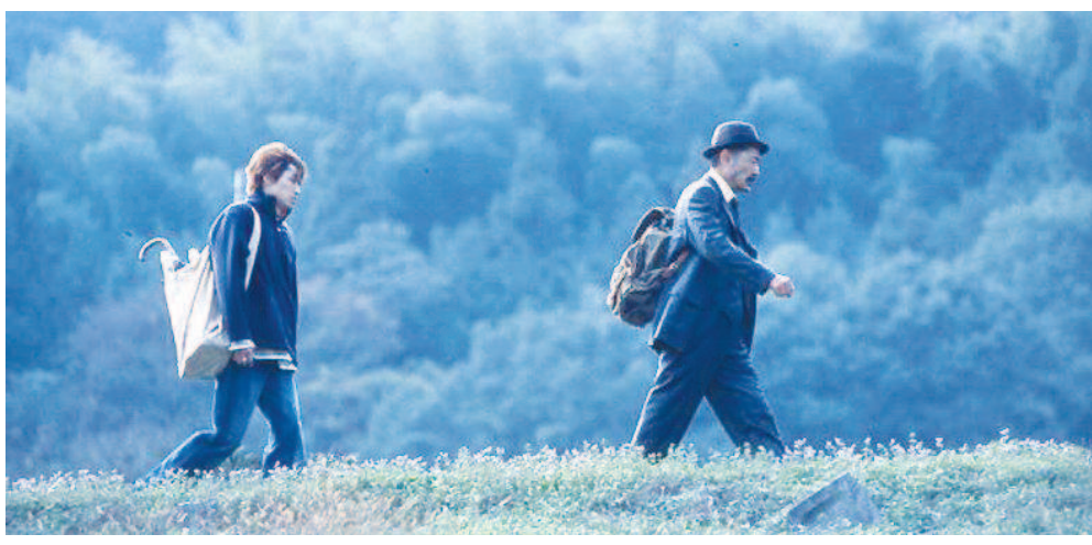
日本影片《乡村写生馆》剧照

罗马尼亚导演，2017年任金爵奖评委会主席 2007年，蒙吉还是名不见经传的罗马尼亚新人，他的《四月三周两天》从一众名导作品中杀出重围，拿下第60届戛纳电影节最佳影片金棕榈奖，从此，他被认为是“罗马尼亚新浪潮”的代表导演。蒙吉的作品不多，《四月三周两天》《山之外》和《毕业会考》这几部力作都在上海国际电影节展映。