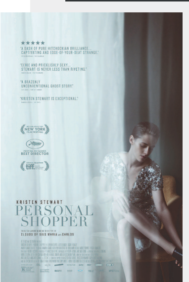
法国影片《私人采购员》海报