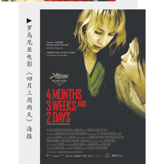
罗马尼亚影片《四月三周两天》海报