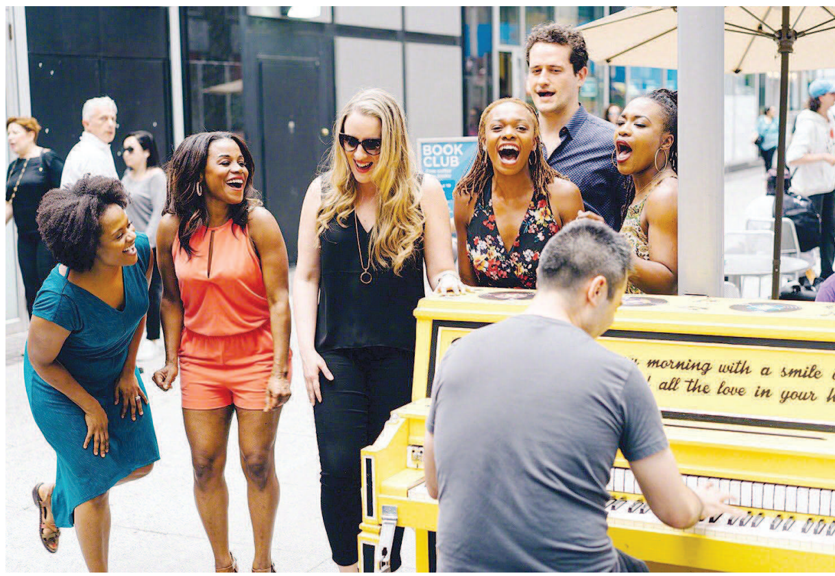
纽约街头音乐爱好者借彩绘钢琴演奏,吸引路人驻足欣赏。

即使音乐已然成为纽约城市文化不可分割的一部分,许多纽约人平时并没有机会接触到乐器。萨莫尔透露,纽约三分之一的孩子无法在学校定期接受艺术教育。因此在夏季项目结束后,这批彩绘钢琴将捐赠给纽约学校,继续发挥“艺术干预”的作用。