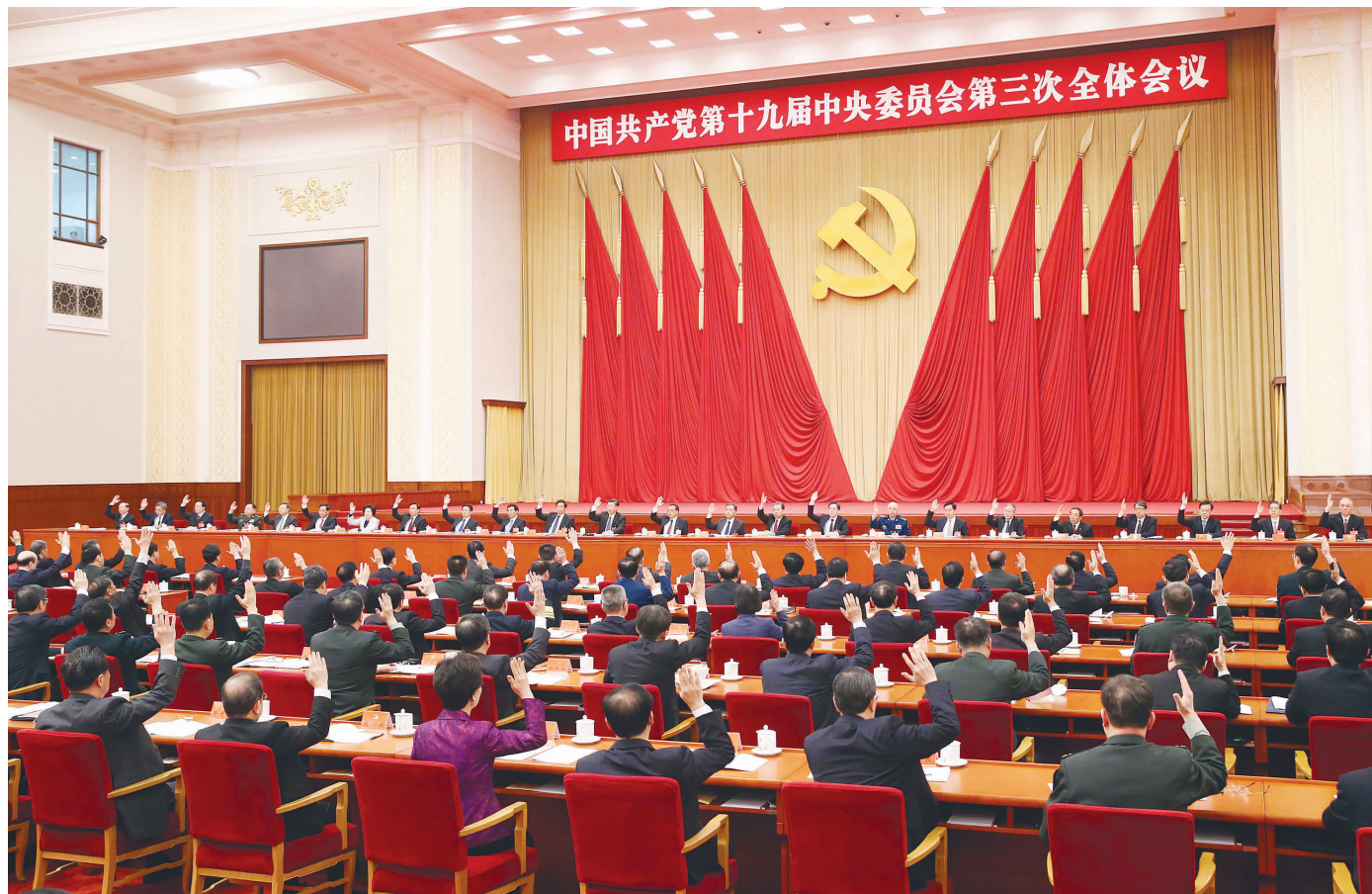
中国共产党第十九届中央委员会第三次全体会议,于2018年2月26日至28日在北京举行。中央政治局主持会议。