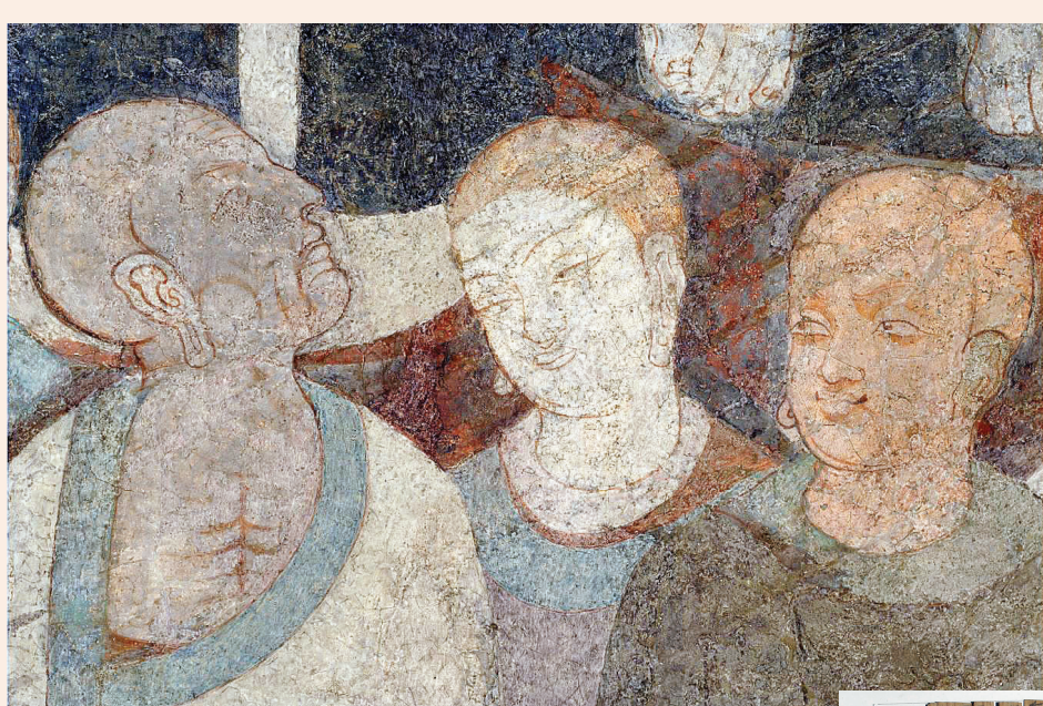
上海古籍出版社出版的《俄藏龟兹艺术品》让流失海外的重量级文物以出版的形式“回归”。

除了简牍,敦煌的纸本文献也是丝绸之路研究必不可少的宝贵资料,其中的藏文文献被看做吐蕃历史文化研究最权威的文本。据不完全统计,目前国内留存下来的敦煌藏文文献约有7092件(卷),而甘肃各处藏有近6700件(卷)。上海古籍出版社推出的《甘肃藏敦煌藏文文献》大型图录将甘肃所藏的敦煌藏文文献全部收录其中,由敦煌研究院组织藏学专家编纂,分为敦煌研究院卷、敦煌市博物馆卷、甘肃省博物馆卷、兰州散藏卷、甘肃省图书馆卷等出版。据透露,这是国内首次全彩出版敦煌文献,整套丛书总计约30册,被列为国家出版基金资助项目,预计两年内出齐。从新近面世的第一册可以看到,为了便于学者使用,书中的每张图版均用汉、藏双语编写说明,同时在每卷后附《叙录》,对图版的原始尺寸以及相关情况进行较为全面的描述。