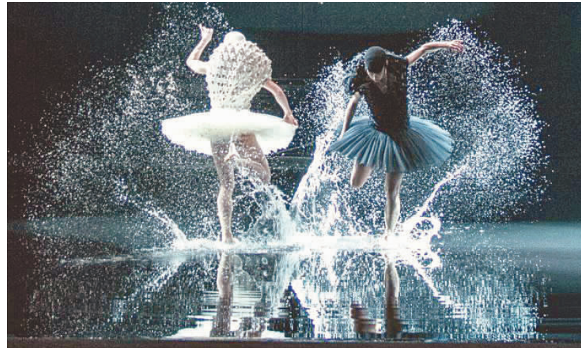
上海国际舞蹈中心大剧场为观众放映亚历山大·埃克编舞、挪威国家芭蕾舞团演出的《天鹅湖》舞蹈影像。图为该版《天鹅湖》剧照。

舞蹈影像放映是用录制手段捕捉现场舞蹈演出,并通过大屏幕实现放映。该技术能更真实且立体地捕捉现场演出,不仅延长了作品的生命,更可以突破演出地理位置和剧场容量的局限,让更多观众有机会欣赏原汁原味的高水准演出。