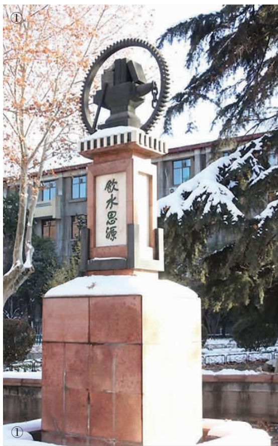
① 西安交通大学“饮水思源”碑。