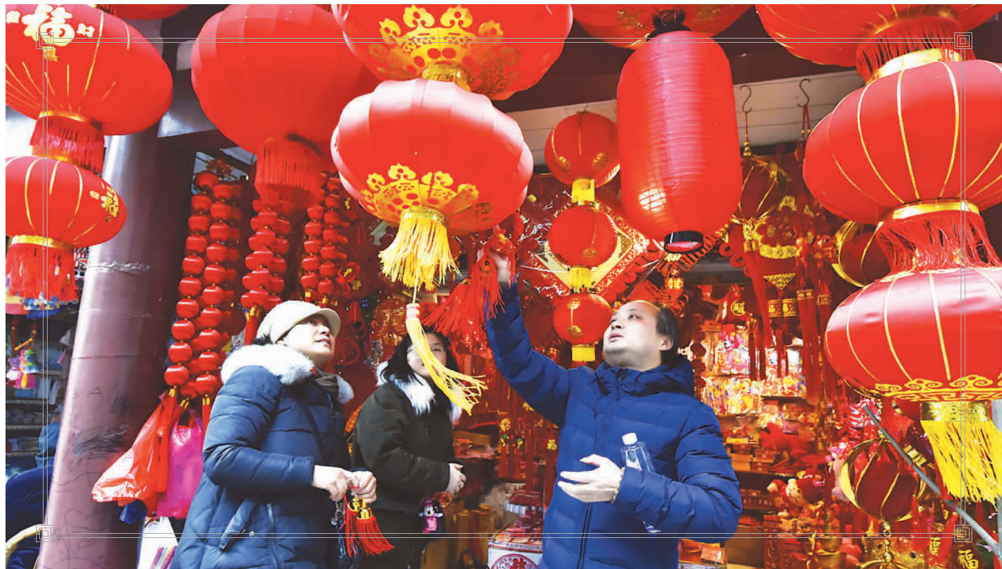
▲市民在小商品市场挑选新年装饰品。