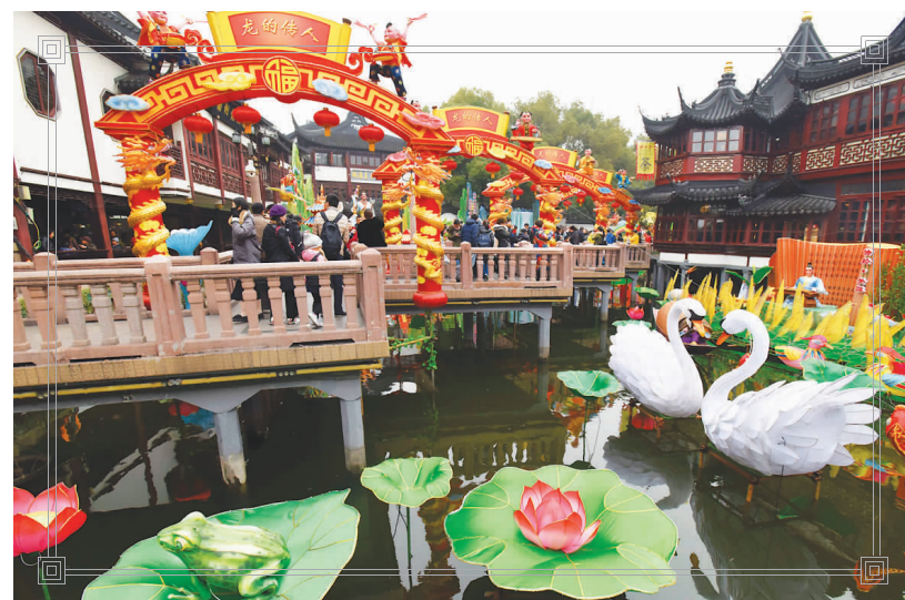
▲豫园九曲桥上的新年彩灯成为展现传统文化的长廊。