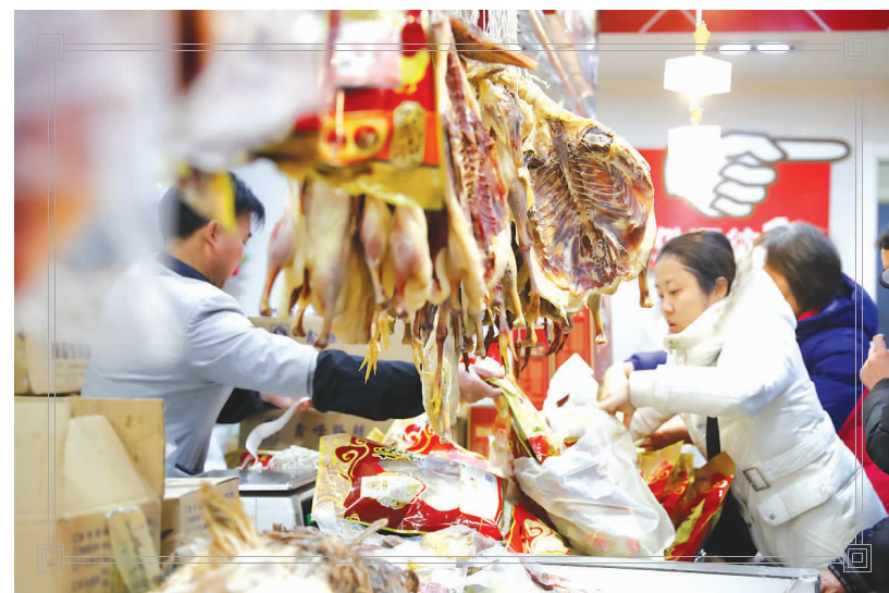
▲市民在第一食品商店腊味柜台选购年货。