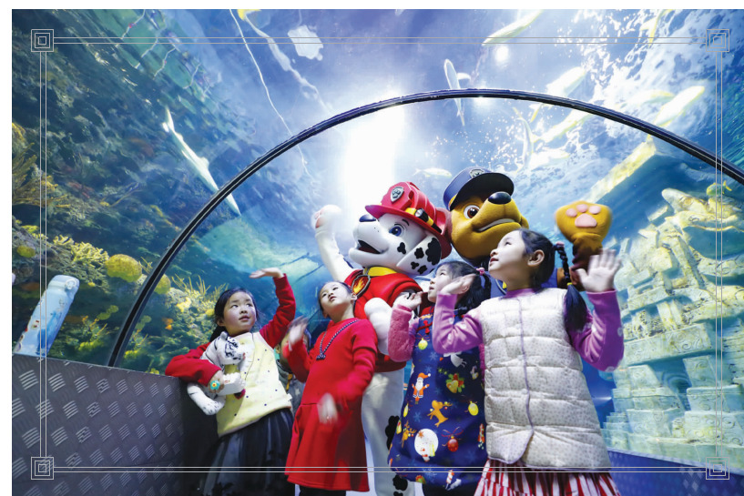
▲海洋馆里小朋友与狗年吉祥物一起参观游览。