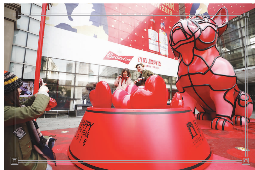
▲新天地设计师的概念版狗年装置艺术吸引市民驻足互动。