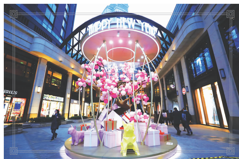
▲新开业的商业中心精心营造新年喜庆气氛。