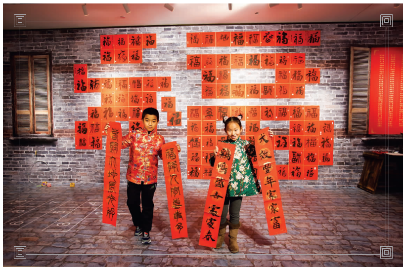
▲身穿传统服饰的小朋友在沪上108位书法家写就的百福墙前留影。