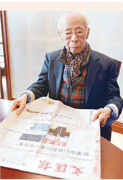
▲让传统文化在当下时代重焕光彩，是饶宗颐先生倾其一生的努力方向。图为饶宗颐阅读文汇报。