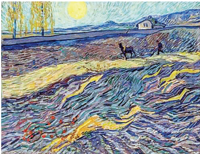
《田野里犁地的农夫》是目前售价第二高的梵高作品，其被亚洲藏家以8100万美元（约合人民币5.08亿元）的价格竞得。（资料照片）