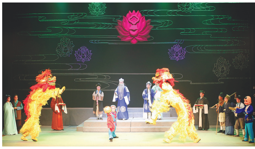
《目连拜佛》展现了一系列调腔目连戏传统特色,也融入了符合当下审美的舞台设计。

舞台上演绎的目连救母历经重重磨难,台下,新昌调腔的传承之路也同样曲折。和许多基层剧团一样,“天下第一”的新昌调腔剧团也是“天下唯一”,这个有着60年历史的剧团,至今仍“蜗居”在县城文化中心,练功房由几间办公室打通而成,没有库房,演出道具、设备只能码在剧场大厅外。