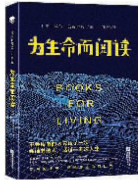
《为生命而阅读》 [美] 威尔·施瓦贝尔著 孙鹤译