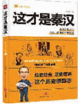
《这才是秦汉》 谷园著 天地出版社二〇一七年十二月版

于是，中年时，他考上公务员，当了亭长，在今天大致是副乡长或乡镇派出所所长。他终于娶了媳妇，边种地边上班。