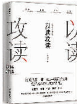
《以读攻读》 但汉松著 译林出版社二〇一七年九月版

但汉松的《以读攻读》收录了他10年来的30篇文学评论，发轫于作者的读，最终复归于读者的读；从英美文学到电影戏剧，再到当代中国小说，精妙细致的评点和剖析，尽显思维的棱角与锋芒。我在通读之后，更加意识到最好的阅