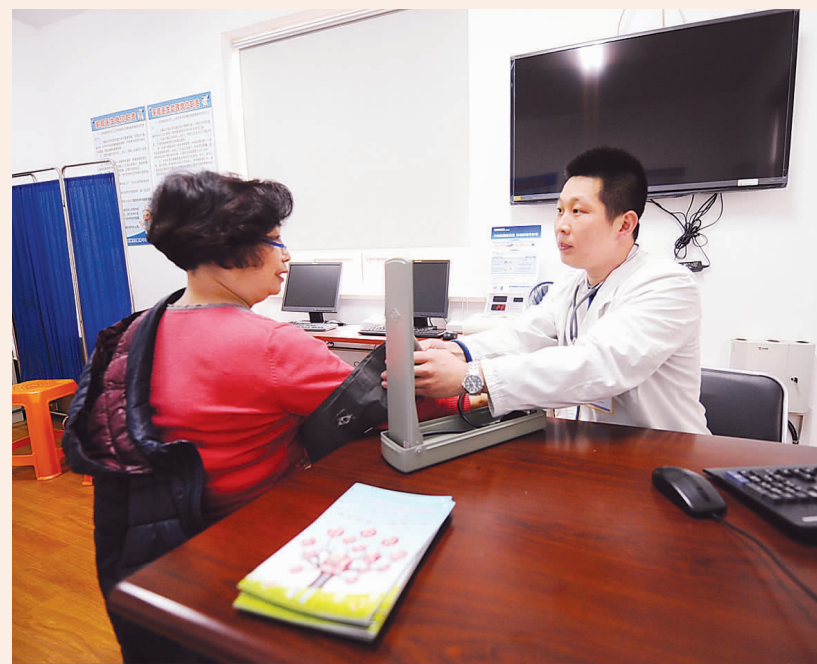
上图：闵行区龙柏社区卫生服务中心设立在龙柏三村居委会内的家庭医生工作室，专业的家庭医生为社区居民提供多样化的治疗服务。左图：在虹口区欧阳路街道举行的家庭医生集体签约仪式上，百余名居民集体签约家庭医生。