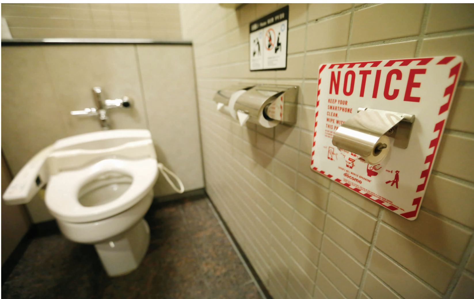
日本东京成田机场内的厕所除了传统的智能马桶盖、两卷手纸等标配外，还特地增加了供人擦手机的专用卷纸，其人性化程度可见一斑。

据悉，日本政府还打算借鉴群马县的经验，在全国推进厕所标志与认证制度。此前，群马县政府提出“厕所是观光一翼”的口号，在2003年确立了“厕所品牌化”战略，设立“群马游客厕所认证制度”，达到标准的厕所可以获得一个认证标志，让内急的游客看见后安全、放心、快捷地使用。与此同时，获得认证的厕所也不是一劳永逸，不能享受“终身制”的荣誉，认证机构每两年就会对获得认证的厕所进行突击检查，不合格标准的自然会被撤销认证。显然，日本政府希望借这一举措来推动和维持全国各地域厕所的高水平。日本内阁官房长官菅义伟2017年在记者会上就曾表示：“2020年日本将举办东京奥运会，那时有大量外国游客到来。我们要努力推进日本的厕所建设，让游客舒心。”(本报东京1月10日专电)