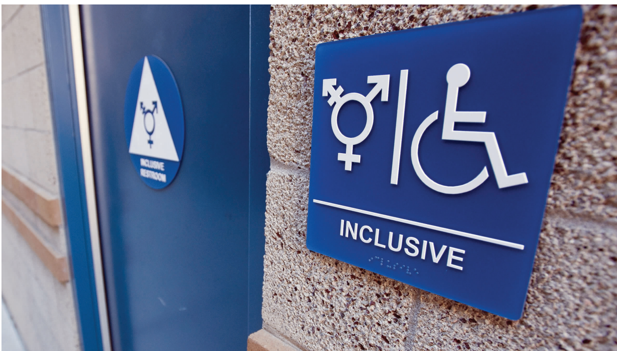
美国加州大学欧文分校内的一座中性厕所及其标识，这座厕所专供LGBT人群及残障人士使用。

白宫和美国大学竞相开设中性公厕，源于2016年3月23日保守的北卡罗来纳州通过的HB2法案，该法案也被称作“厕所法案”，根据法案规定，