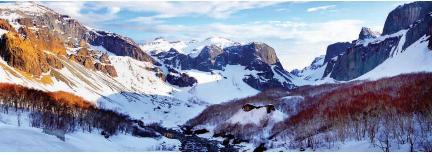
零下20多摄氏度的长白山,有一种别样的壮美,容不得一丝污垢存在。“一定要守护好白山松水,还有那望不到边的黑土地。”