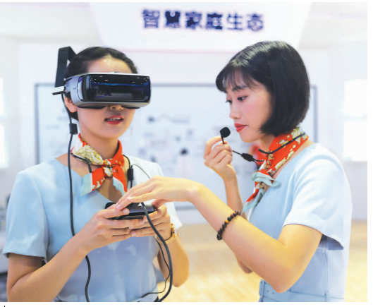
图1：人在家中坐，千兆光网任我游。图为美女们体验千兆光网环境下的VR感觉。

今年的3月5日，新一轮“提速降费”拉开序幕，中国电信上海公司坚决贯彻落实国家以及中国电信集团公司相关部署，持续推进“提速降费”，不断完善网络基础设施、提高网络质量、降低用户上网资费。早在2009年，中国电信上海公司就率先实施“城市光网(Monet)”行动计划，全面推进光纤化网络建设，实行家庭宽带光纤接入，切实提升家庭宽带网络质量水平。