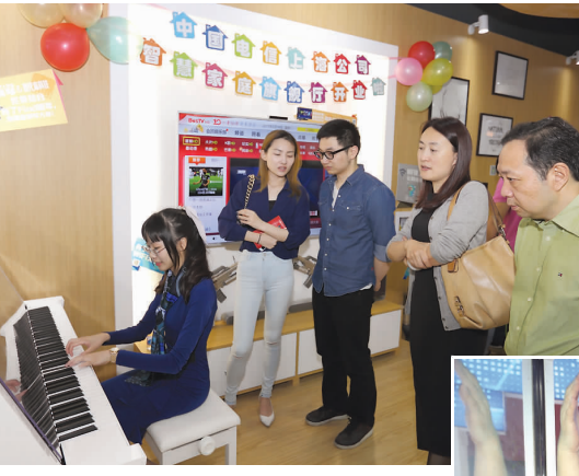
图2：电信的智能钢琴，吸引客户观看。