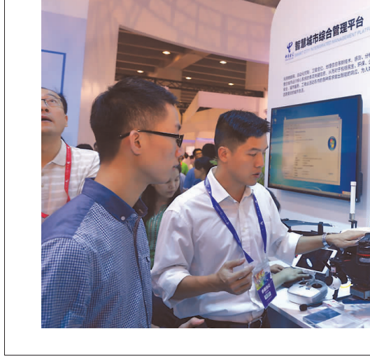
图6：电信的无人机监控，已经在智慧城市管理平台中发挥巨大作用。图为客户在了解无人机监控信号的传输路由。