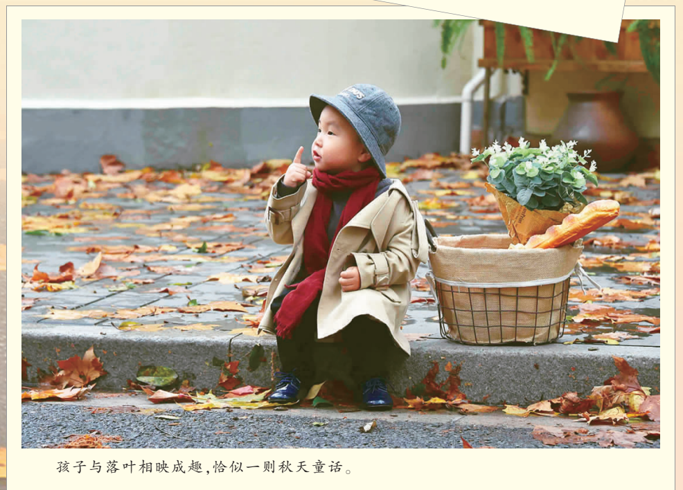
孩子与落叶相映成趣,恰似一则秋天童话。