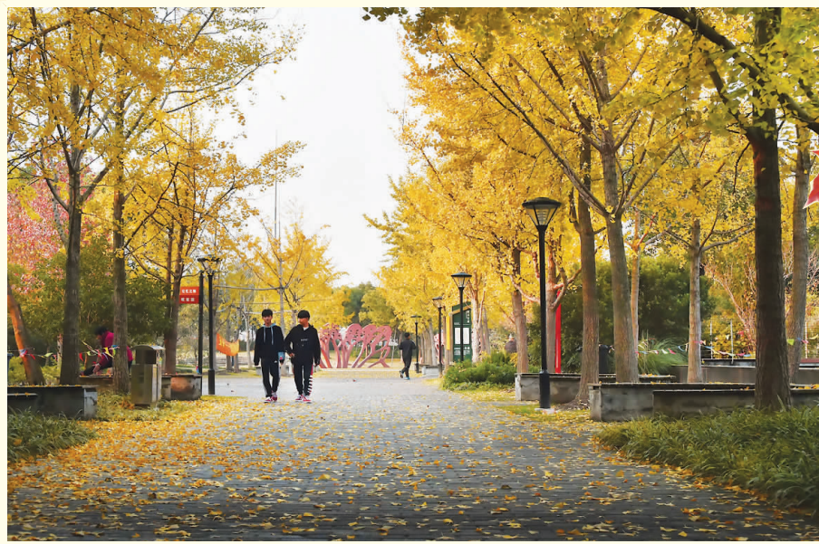
宝山区钟园公园入口处的银杏大道秋意浓郁。