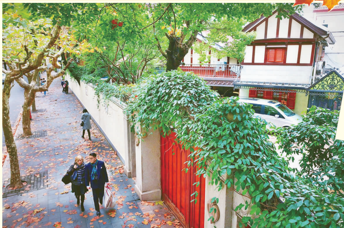
徐汇区武康路“落叶不扫”,与周边老房子相得益彰。

近日,各区推出的29条落叶景观道路又集体登场,徐汇区7条马路率先实施“落叶不扫”。常见的色叶树如枫香、悬铃木、银杏等树种,其变色与昼夜温差、光照等因素密切相关,一旦气温降至10℃以下,加之风力,缤纷的落叶就会“翩翩起舞”,成为这个季节独特的风景。