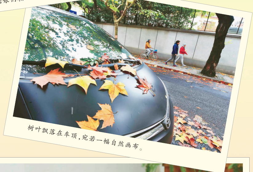
树叶飘落在车顶,宛若一幅自然画布。