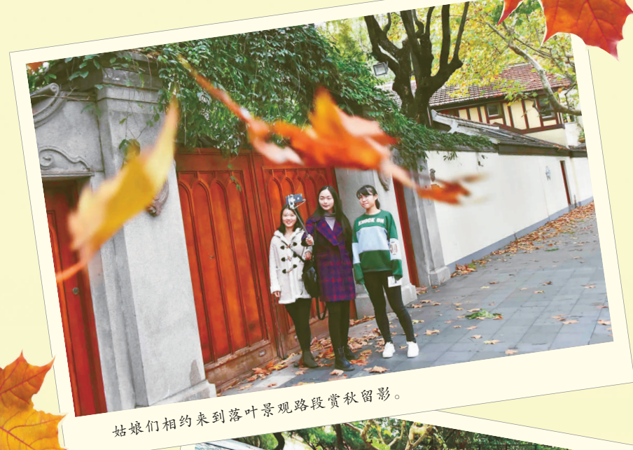
姑娘们相约来到落叶景观路段赏秋留影。