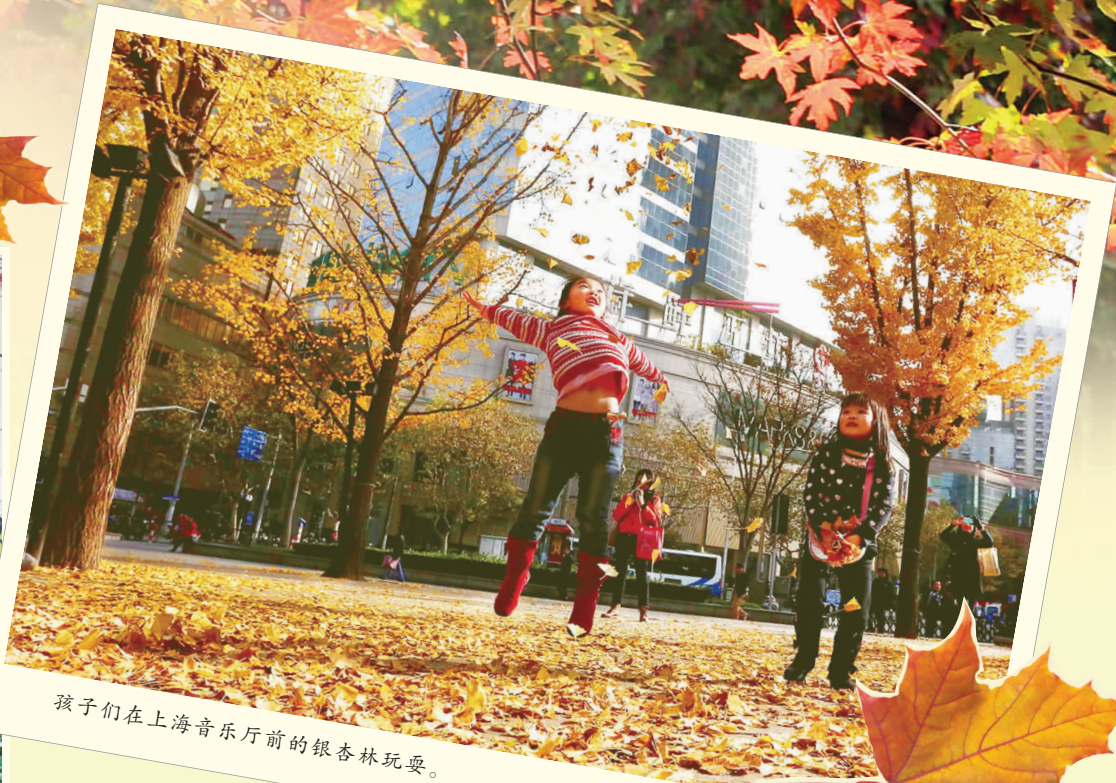
孩子们在上海音乐厅前的银杏林玩耍。