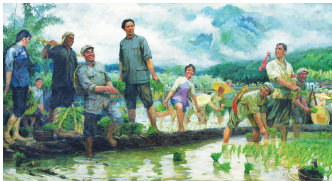
刘海粟《庆祝社会主义改造胜利》(局部)

以井冈山为题材的美术作品不在少数,这幅创作于1976年的油画依然亮眼。创作者聚焦毛泽东与井冈山地区军民一起插秧的场景,予人春风化雨、润物无声的清新观感。为了创作这幅作品,唐小禾、程犁伉俪曾在井冈山漫山遍野的映山红中、群山环抱的田间陇上、领袖足迹和故居旧屋前,画了大量的色彩写生,当他们看见插秧季节中农忙的景象,最是为之触动,由此生发出《井冈春雨》。