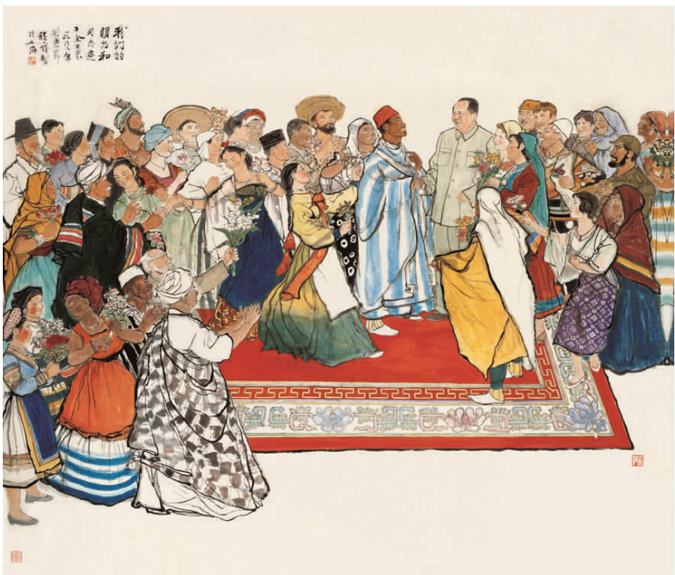
程十发《我们的朋友和同志遍于全世界》

石奇人 《曙光——中国共产党成立(上海)》 作品以艺术笔法定格中国共产党在上海召开第一次全国代表大会的重要历史时刻。作者根据史料,如实再现了当时十几位创始人召开会议时环绕长桌而坐的场景。