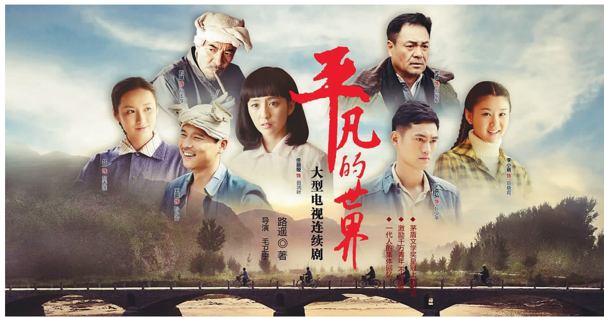
相信生活,相信理想,做一个真实而坦荡的人,《平凡的世界》道出了人心深处的呼唤。