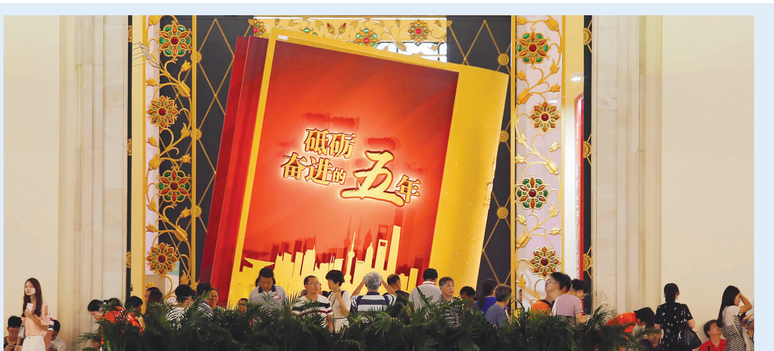
上海书展入口处一部壮丽宏阔的“大书”引人注目,“书封”上写着苍劲有力的七个大字——砥砺奋进的五年。

中国出版界正达成共识——如果越来越多的主题出版物能既讲高度也有温度,那么整个“主题出版”的矩阵就有可能与“畅销书”直接挂钩。